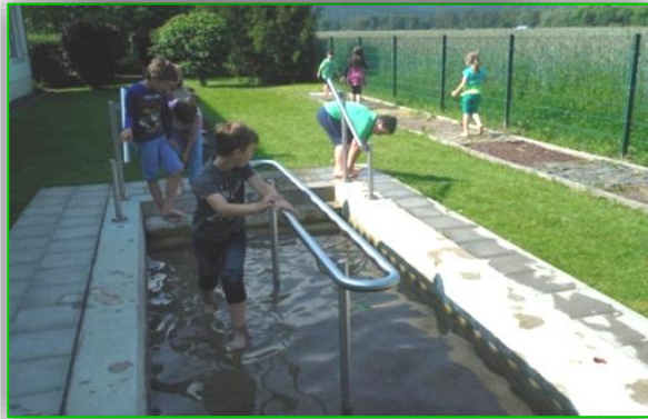
Kneippbecken und Barfußpfad